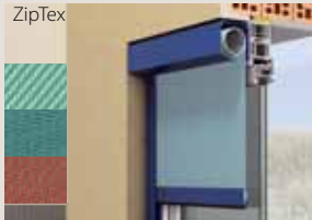
textiler Sonnenschutzbehang ZipTex

Natürlich bieten sich Vorbaulösungen von ALUKON an, Farbakzente in der Fassade zu setzen (5). Die fast unbegrenzte Farbauswahl eröffnet einen riesigen Gestaltungsspielraum.