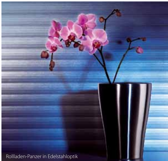
Rollladen-Panzer in Edelstahloptik

Ganz gleich, welche Anforderungen Sie an Ihr Beschattungssystem stellen, ALUKON hat dafür die passende Antwort. Stimmig im Design, überzeugend in der Funktion. Motorisierte Rollläden, Raffstore mit verstellbaren Lamellen, ZipTex Behänge oder s_onro®, der die Vorteile von Rollläden und Raffstore kombiniert. Für welche ALUKON-Lösung Sie sich auch entscheiden, unsere aus Aluminium geformten Rollladenpanzer verfügen über hohe Formstabilität, sind widerstandsfähig und bieten entsprechende Sicherheit bei gleichzeitig langer Lebensdauer.